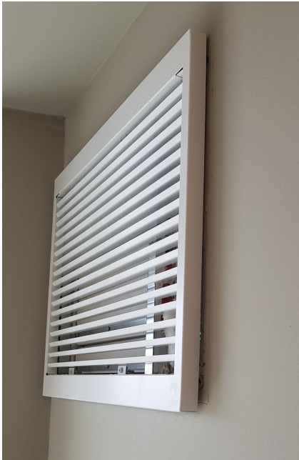
Beispiel: TRA / Lamellen-Schutzgitter RAL 9016